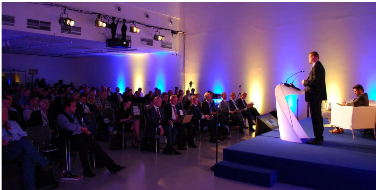
Vicepremiér Pavel Bělobrádek při svém projevu na zaplněné konferenci „Česko – silný hráč v evropské lize“

Číslo účtu: 115-5549290247/0100 IBAN: CZ80 0100 0001 1555 4929 0247