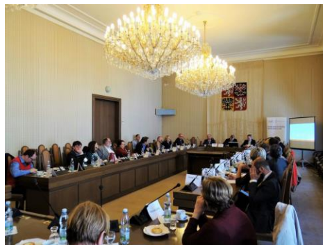
Kulatý stůl na téma Vzdělání, který se konal pod záštitou Jiřího Miholy

Během kulatého stolu, který se konal pod záštitou místopředsedy Výboru pro vědu, vzdělání, kulturu, mládež a tělovýchovu Poslanecké sněmovny PČR Jiřího Miholy (KDU-ČSL) a u kterého se sešli odborníci na vzdělávání, se debatovalo o budoucnosti oblasti českého vzdělávání. Jednání se zúčastnili zástupci vlády ČR, rektori univerzit a zástupci asociací a společností zabývajících se vzděláním.