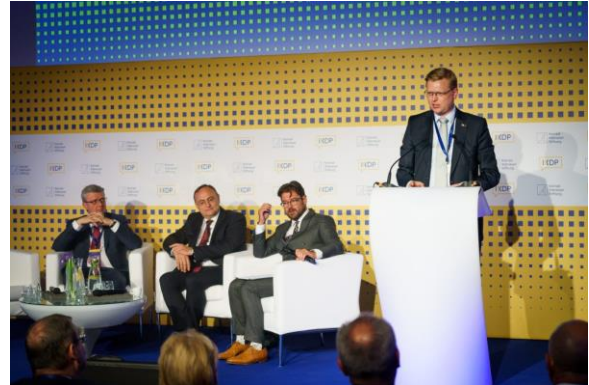
Vicepremiér Pavel Bělobrádek hovoří o důležitosti vědy a inovací na konferenci „Česko – silný hráč v evropské lize“