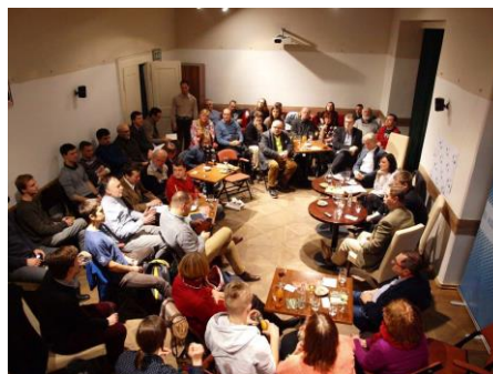
Publikum na jednom díle cyklu Besed v Besedě v Malostranské besedě

Besední cyklus na aktuální i nadčasová společensko-politická témata probíhal v pondělí každých 14 dní v Malostranské besedě v Praze. V roce 2017 bylo zorganizováno 19 dílů, na které dorazili například tito hosté: Karel Janeček, zakladatel Nadačního fondu proti korupci, Petr Honzejek, novinář, Michaela Šojdřová (KDU-ČSL), poslankyně Evropského parlamentu, Jan Čížinský (KDU-ČSL), starosta městské části Praha 7, Oldřich Dědek, člen bankovní rady ČNB, Andor Šándor, generál v záloze a bezpečnostní poradce.